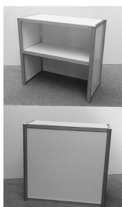
5. Lada informacyjna / Information counter