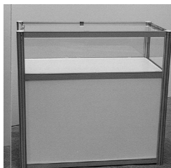
2. Gablota / Glass display cabinet