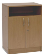
20. Szafka / Closet