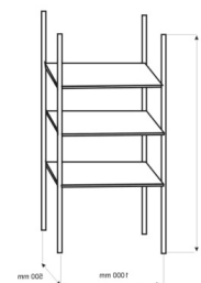
7. Regał / 3-shelf rack