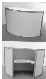
6. Lada informacyjna łukowa / Arch information counter