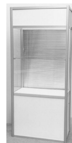
3. Witryna / Glass display cabinet