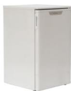
19. Lodówka / Fridge